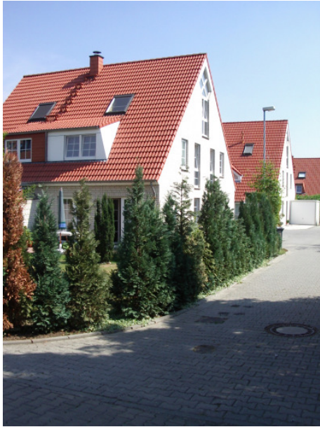
Wandaufbau von innen nach außen: 12cm KS-Planblockelemente, 12cm Kerndämmung und 10cm Klinker