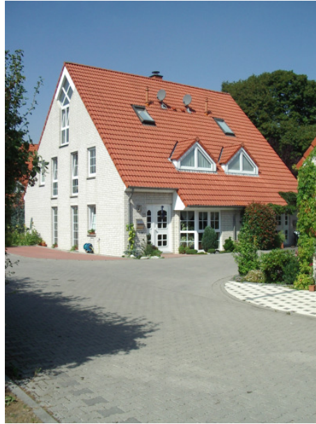
Die Dächer wurden als vorgefertigte Sandwich-Elemente auf der Baustelle montiert und die Stöße nachträglich verklebt: 20 cm Styropor-Vollsparrdämmung

Die Planung beinhaltet die Erstellung eines Lageplans einschließlich der Erschließung sowie die Entwurfs- und Genehmigungsplanung