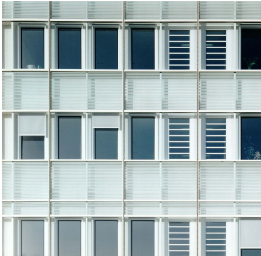
▲ Twin-Face Fassadenanschnitt eines Telekom-Verwaltungsgebäudes in Köln - Weinsbergstrasse

Umbaumaßnahme aus dem Jahr 1995 Projekt der Deutschen Telekom